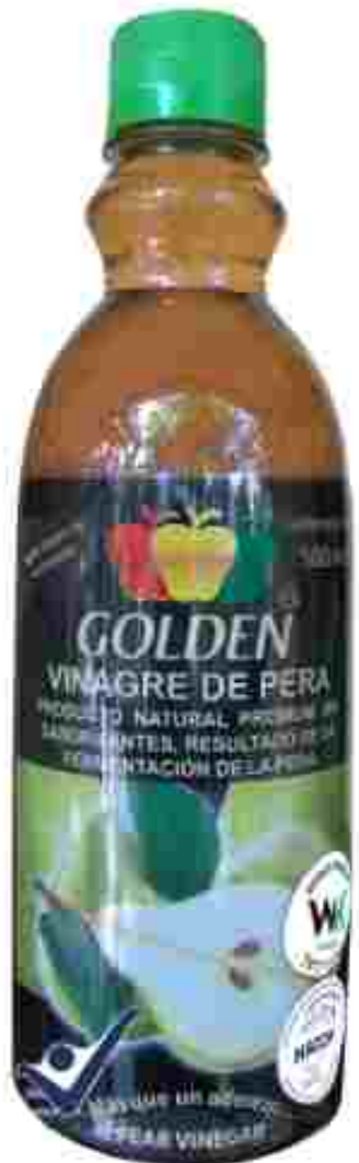
VINAGRE DE PERA PEAR VINEGAR 500 ml / 16.9 fl Oz