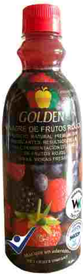
VINAGRE DE FRUTOS ROJOS BERRIES VINEGAR 500 ml / 16.9 fl Oz