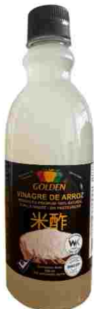
VINAGRE DE ARROZ RICE VINEGAR 500 ml / 16.9 fl Oz

Vinagre elaborado con Arroz Orgánico certificado / Vinegar made with certified Organic Rice